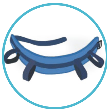
Cinturón de transferencia