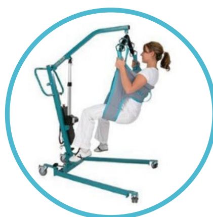
Grúas de traslado