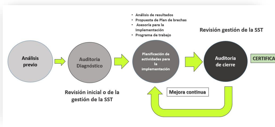
Esquema de Implementación Programas SG SST familia PEC v2025

El presente SG SST PEC Autogestión y su proceso de implementación en la empresa, se realiza a través de cuatro etapas: Promoción, Auditoría Diagnóstico, Planificación de actividades para la implementación y Auditoría de cierre.