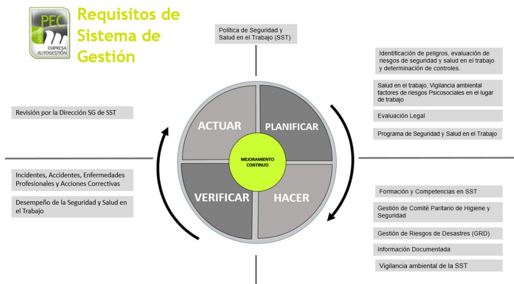
Modelo PEC Autogestión V2025, ciclo de mejora continua

Tal como se muestra en la siguiente imagen, el Programa SG SST PEC Autogestión, satisface los requisitos del ciclo de mejora continua en la gestión de seguridad y salud en el trabajo.