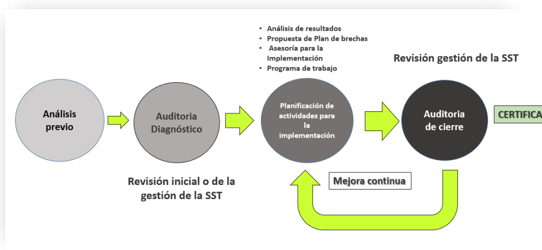
Esquema de Implementación Programas SG SST familia PEC v2025

El presente SG SST PEC Estándar y su proceso de implementación en la empresa, se realiza a través de cuatro etapas: Promoción, Auditoría Diagnóstico, Planificación de actividades para la implementación y Auditoría de cierre.